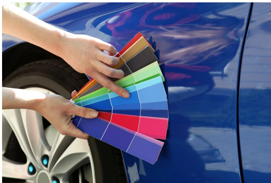
Paleta de cores de carros

Por Alexandre Carneiro • 10/09/20 às 09h00