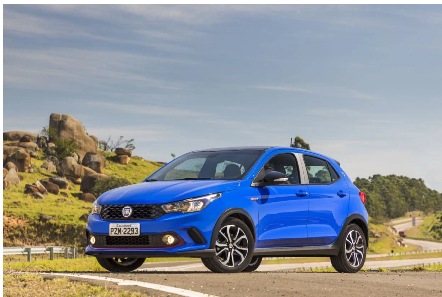
Cores como o azul Portofino, que já foi disponibilizada para o Argo HGT, não estão mais disponíveis no configurador do site da Fiat

Tonalidades como azul Portofino, Verde Savage e amarelo Citrus, que foram oferecidas em veículos Fiat até pouco tempo atrás, acabaram sendo abolidas. Agora, além de branco (sólido ou perolizado), preto, prata e cinza, há apenas uma opção: vermelho Montecarlo.